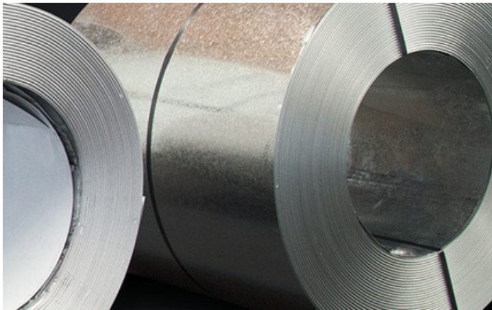
Lámina embobinada en rollos de 3', 4' y cintas de 2' con largos variables dependiendo de los pesos y calibres de los mismos.

Estos se pueden encontrar en diferentes acabados, colores y texturas dependiendo de las necesidades del cliente.